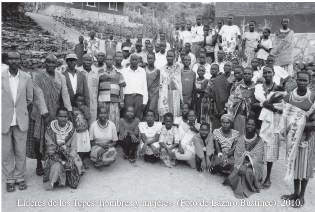
Líderes de los Tepes: hombres y mujeres. (Foto de Lázaro Bustince). 2010.

Actualmente funcionan 145 grupos de personas formadas para recoger los relatos y deseos de los habitantes de esta región tan castigada por muchos años de duros conflictos armados. Los reportajes son difundidos por radio Maendeleo para que los oyentes puedan conocer la situación difícil vivida por la gente y los habitantes de la provincia puedan expresar sus expectativas a las autoridades. Con la radio Jolly quiere “destapar los oídos” de las mujeres y de los hombres del Kivu, liberar su corazón y su lengua para denunciar tanto dolor e injusticia como están sufriendo y poder cambiar la situación. Uno de los temas que Radio Maendeleo trabaja desde hace años es la violencia sexual. También quiere trabajar en la prevención y resolución de conflictos y en la necesidad de que las mujeres participen en las iniciativas del mantenimiento y fomento de la paz. Jolly Kamuntu ha merecido el premio Harubuntu 2012 de Comunicación por su dinamismo, su creatividad, su trabajo de promoción de la mujer a través de las ondas. Por haber sido durante muchos años “la voz de la libertad.