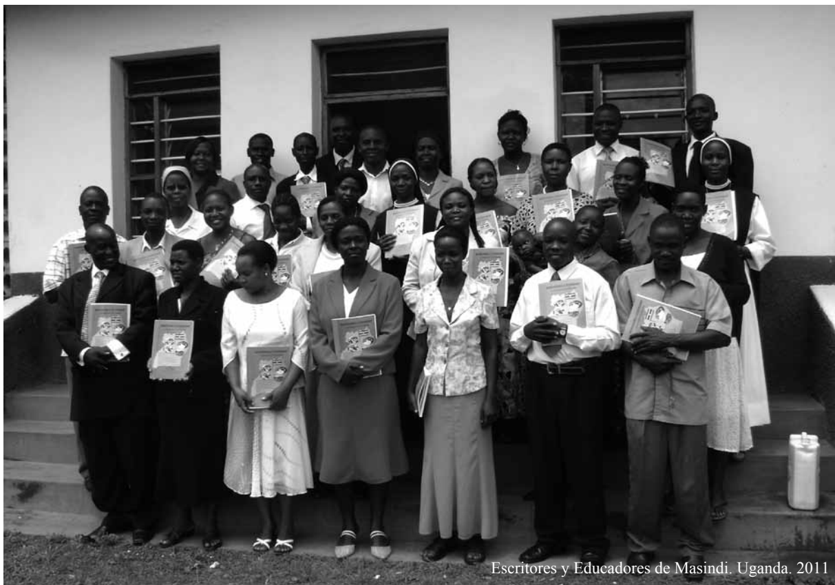
Escritores y Educadores de Masindi, Uganda, 2011

Estos y otros autores como Ben Okri y Chimamanda Ngozi Adichie en África Occidental, han entrado en la escena internacional de la publicación para atraer a un público mundial, más que local. Sus temas y formas son “transculturales” aunque no dejen de beber en las fuentes tra-