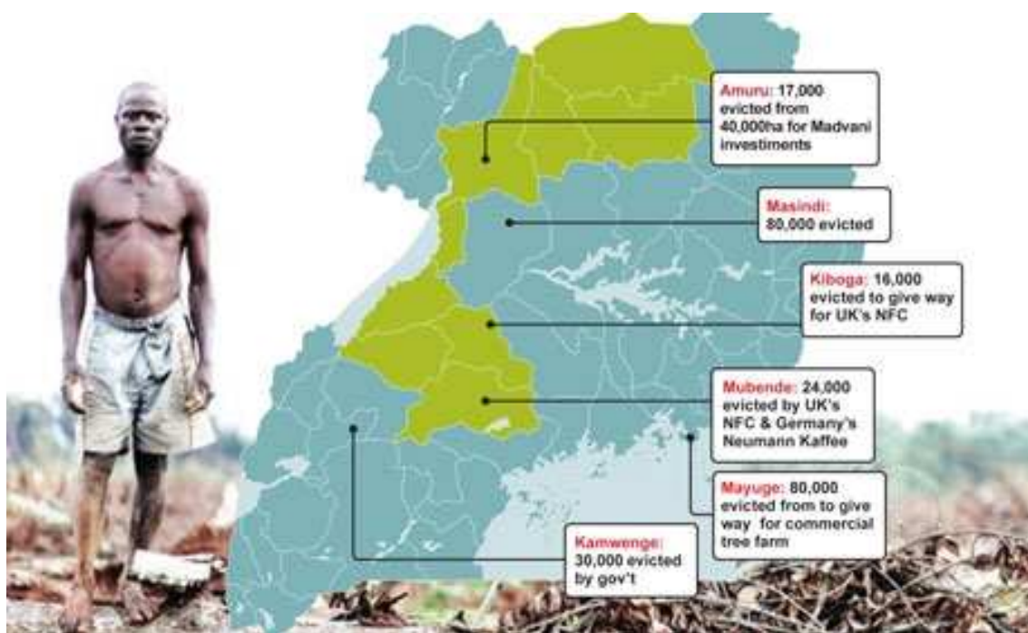
Localización de la expropiación de tierras, en seis de los ocho casos listados.

Además de estos cuatro casos precisados, podemos afirmar que estos son solamente la punta del iceberg. Según “The Independent” existen cientos de lugares donde se dan expulsiones, y más están por llegar.