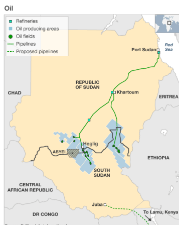
Yacimientos petroleros en Sudán y Sudán del Sur.