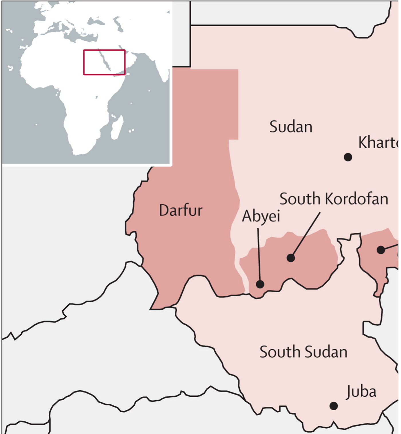
Darfur y las Tres Áreas de Sudán.

Sin embargo, hubo olvidados en el Acuerdo General de Paz. Desde un primer momento fue patente que a las denominadas Tres Áreas —Kordofán del Sur, Nilo Azul y Abyei— no les iba a ser tan fácil conseguir la independencia, ni tan siquiera una mayor autonomía que impidiese el expolio de sus ricos recursos naturales. Ello a pesar de que una importante parte de su población había luchado junto con el ELPS en contra del Gobierno de Jartum debido a la marginalización a la que habían sido sometidos durante décadas. Abyei, región que debería tener un estatus administrativo especial hasta la celebración de un referéndum que tendría que haberse celebrado en 2011 , cuenta con elementos de diferenciación, pero los dos estados fronterizos sudaneses han seguido un trascurso paralelo: en ambos las imprecisiones del Acuerdo de Paz desembocaron en 2011 en un conflicto armado con un desenlace difícil de prever.